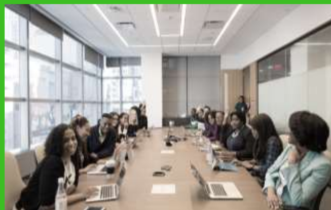
МАОУ СОШ №32 г.Томска