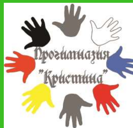
МАОУ прогимназия «Кристина»