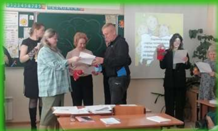
МАОУ гимназия №26 г.Томска

А здесь может быть КОЛЛЕКТИВ ВАШЕЙ ШКОЛЫ