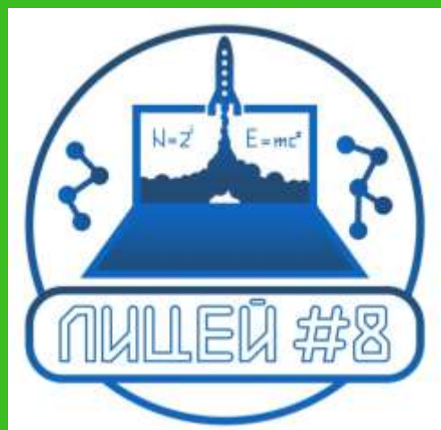
МАОУ лицей №8 г.Томска