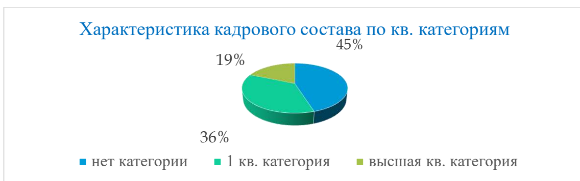
Диаграмма 3.9.1. Кадровый состав школы по квалификационным категориям

Таким образом, 55% педагогического коллектива на конец учебного года имеют квалификационную категорию, что на 10% меньше в сравнении с предыдущим учебным годом.